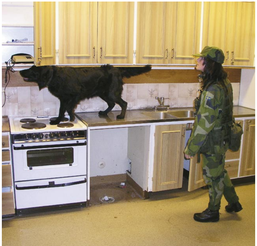
Eva-Karin Sjödin med Tjära genomför preparatsök inomhus.

– Det är stimulerande att få vara med och utveckla något nytt och samtidigt få se hur effektiv en hund kan vara vid olika typer av arbete. Dessutom är det både roligt och lärorikt för oss själva att få göra något så här pass annorlunda tillsammans med våra hundar.